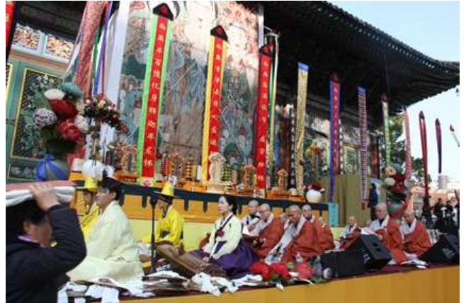
<사진> 조계사 생전예수재 모습