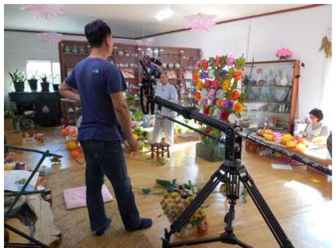
<사진> 중요문화문화재 연등회 영상기록 촬영현장 가평 영화세계 지화제작부분