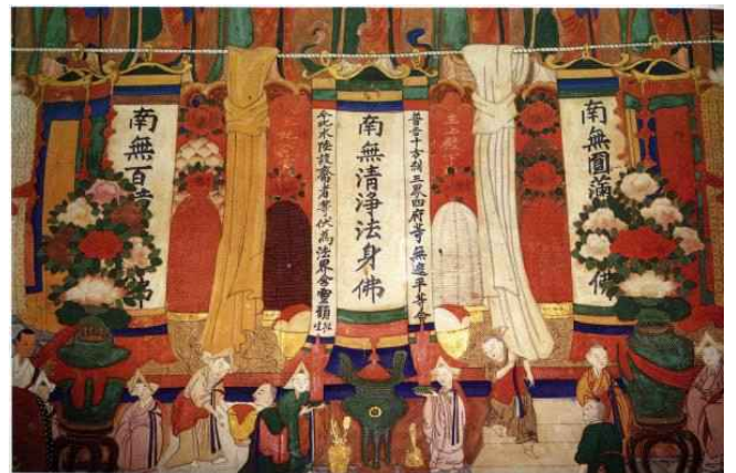
<사진> 불교지화장엄전시전에서 선보인 1890년대 불암사 감로명화 재현작. 한송이 지화를 만들기 위해 전통지화 사상 최대인 지름 50cm 종이가 쓰였다. 잊혀져가는 전통 예수재를 복원하고자 지화장엄을 위해 제작한 지화는 모두 전통한지에 자연염료로 천연염색하고 옛 기법으로 만든 것이다.