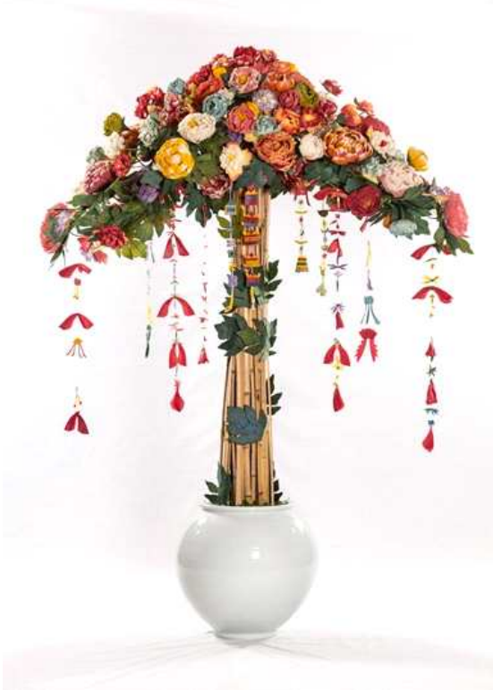
<사진> 생전예수재 때 불단을 장엄한 정명스님 작품