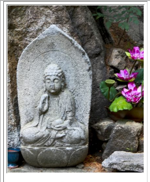
해원사 약사여래불, 부처님의 코가 영험있다는 속설에 의해 누군가가 부처님의 코를 베어갔다.