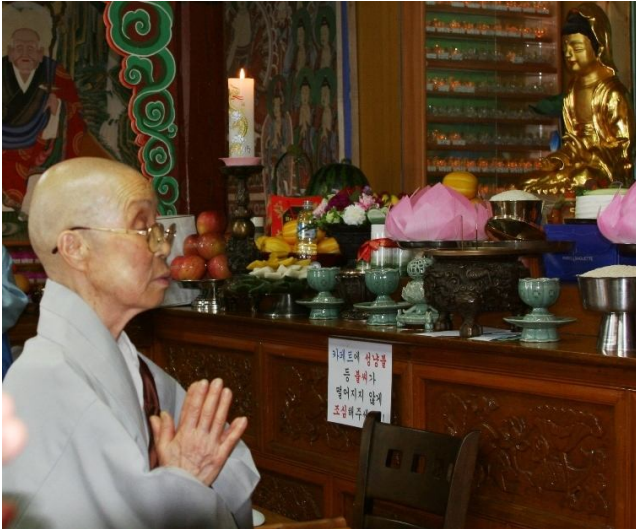
<해원사 수봉 노스님>