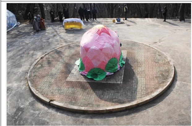
정명스님이 연꽃모양으로 장엄한 다비장에서의 지관스님 연화장