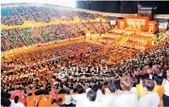
<자료사진: 2010년 국제공불재승대회>

해원사에서는 관음천일기도 300일 기도가 끝난 9월 1일~6일 대만 공승(供僧)법회에 참가할 예정입니다. '대만 국제공불재승대회'란 세계불교 16개국 고승 대덕 및 7천여분의 스님과 함께 올리는 '우란분재대법회'를 말합니다.