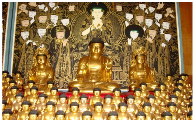
<개금불사중인 연화세계 석가모니불(위) 아미타불, 관세음보살, 대세지보살(아래)>