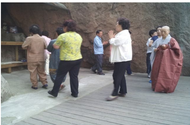
<해원사 초파일 도량돌기>