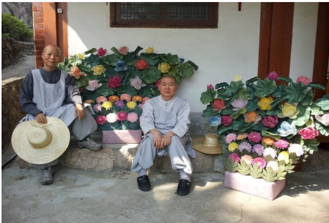
<부채난등 천연염색 지화장엄>