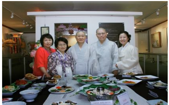
<자료사진: 2011년 제6회 연꽃축제>