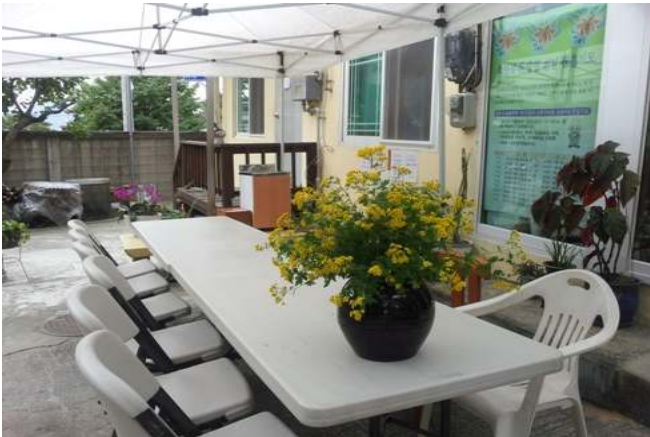
<해원사 도량에 공양간>