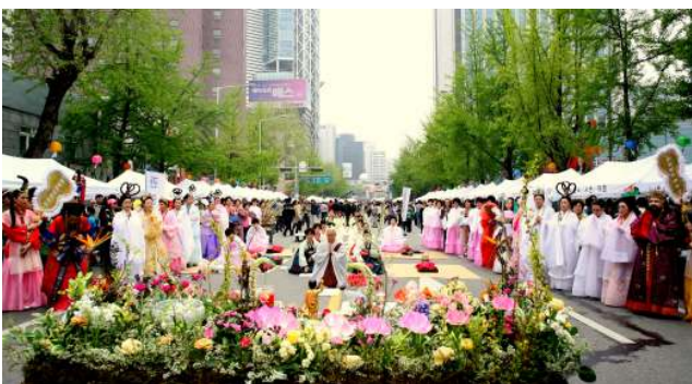
<연화세계 주관 아기부처님 이운식 모습 >

초파일 '연등행렬-회향한마당'이 5월 11일(토) 종로 거리와 조계사 앞길에서 열리고 다음날인 5월 12일(일)에는 '전통문화마당'이 조계사 앞길에서 열립니다.